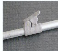
PowerGrip Rohrfeststeller für ein komfortables Ausspannen.

Empfehlenswertes Zubehör (optional lieferbar)