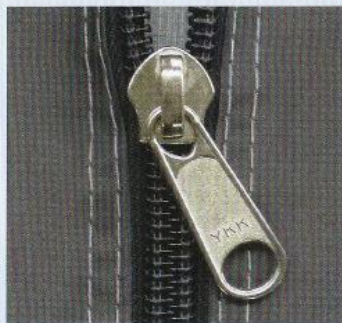
... mit hochwertigen Markenreißverschlüssen in schwerer Ausführung.

Mögliches Zubehör: Gestänge gegen Mehrpreis in 28 mm Aluminium, 28 mm Stahl, 32 mm Stahl oder 32 mm Aluminium. Vordachverstärkung, SHS Halteösen und weiteres Zubehör aus unserem Katalogangebot.